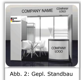
Abb. 2: Gepl. Standbau