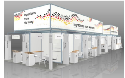
Abb. 1: Standkonzept 2017

German Sweets e.V., GEFA e.V. und WTSH - Wirtschaftsförderung und Technologietransfer Schleswig-Holstein GmbH (Kiel) organisieren gemeinsam die 4. Deutsche Gemeinschaftsbeteiligung auf der weltweiten Leitmesse für Food-Ingredients. Das seit 2011 eingesetzte Standkonzept garantiert dabei einen hohen Wiedererkennungswert.