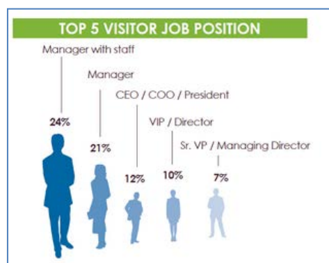
Abb. 2: Besucherstatistik 2015