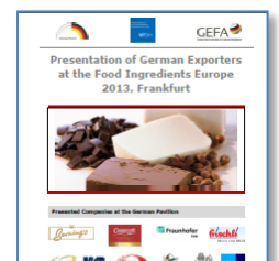
Abb. 3: Ausstellerbroschüre