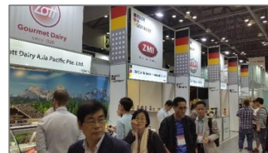
Abb: 2 GEFA Pavillon 2017