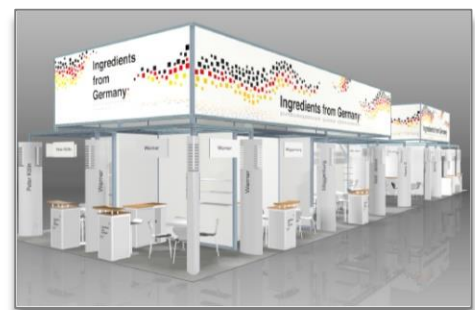
Abb: 3 Standbaukonzept