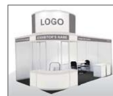
Abb: 2 Geplanter Firmenstand

So nehmen Sie teil: Bitte teilen Sie uns Ihre verbindliche Buchung bis 28.11.2017 mit. Verwenden Sie dazu bitte das beigefügte Antwortformular.