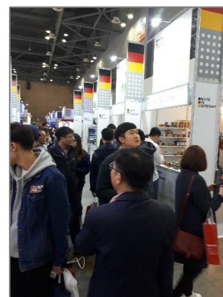
Abb. 2: Starker Besucherandrang am GEFA Pavillon 2018

So nehmen Sie teil: Bitte teilen Sie uns Ihre verbindliche Buchung bis 31.10.2018 mit. Verwenden Sie dazu bitte das beigefügte Antwortformular.