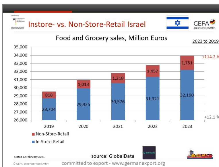
Abbildung: Der israelische Lebensmittelhandel

Die GEFA Exportservice GmbH und die AHK Israel führen in Israel Store Checks durch. Bei diesen Store Checks werden die gewünschten Sortimente Ihres Unternehmens berücksichtigt. Ihrem Unternehmen wird ein Überblick über das gewünschte Sortiment in Israel z. B. durch Marktfotos mit Preisangaben, Verpackung/en, Regalbild, Einzelpackungen Vorder- und Rückseite im hochpreisigen Lebensmitteleinzelhandel, Fachhandel und Discount verschafft.