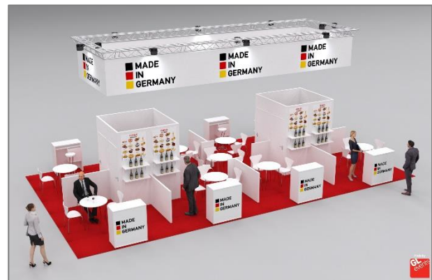
Abb. 2: Geplanter Standbau