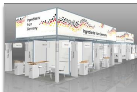
Abb: 2 Standbaukonzept

Die Deutsche Gemeinschaftsbeteiligung befindet sich in der Halle 3.1 in unmittelbarer Nachbarschaft zum US-Pavillon - neben weiteren Länderpavillons und großen Ständen der Global Player der Ingredients Branche. Angestrebt wird eine Beteiligung zwischen 200 und 300 qm.