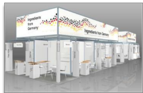
Abb: 2 Standbaukonzept

Die Deutsche Gemeinschaftsbeteiligung befindet sich in hervorragender Lage direkt am Eingang der Halle 3 sowie am Hauptgang, der die Hallen 3 und 4 miteinander verbindet. Angestrebt wird eine Beteiligung zwischen 200 und 300 qm.