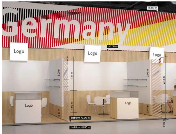
CAD: 9 m 2 Stand